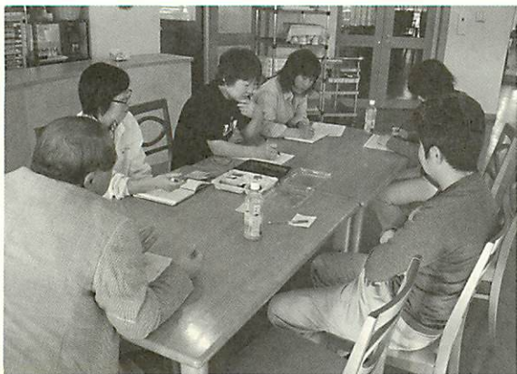
定期的に行われる弁当会議

四〇〇円、五〇〇円弁当を中心に、ご予算に応じて承ります。お気軽にお問い合わせください。