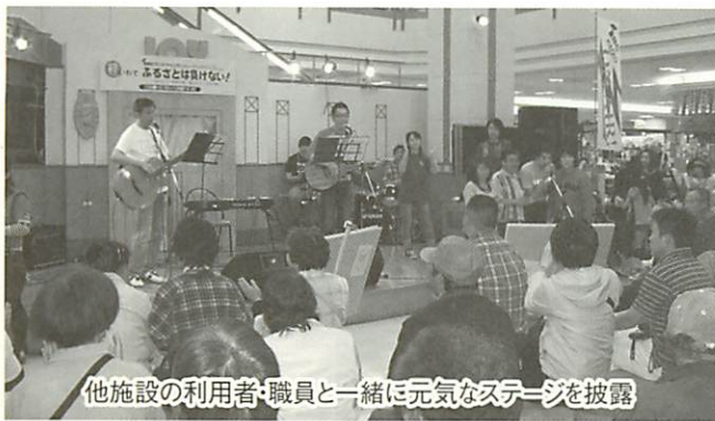
他施設の利用者・職員と一緒に元気なステージを披露