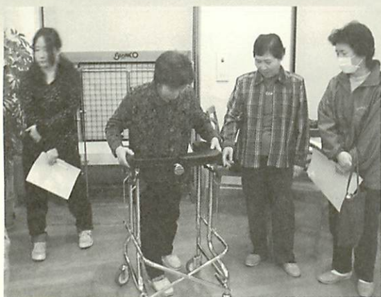
「これなら安定する」と保護者も体験。