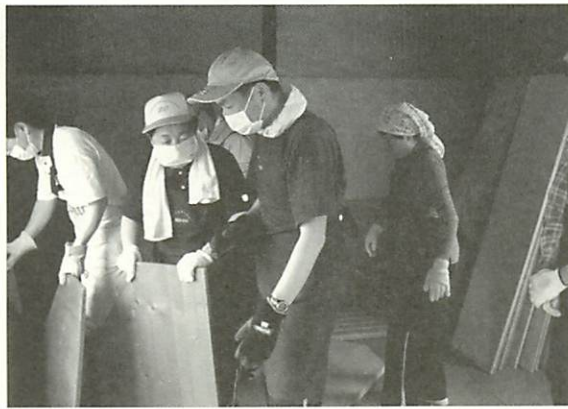
「リサイクルショップ復活だ!!」と準備を手伝う利用者

三月二十二日、当施設長が大船渡へ走り、状況を確認。その後、利用者・保護者・職員が訪問をしています。