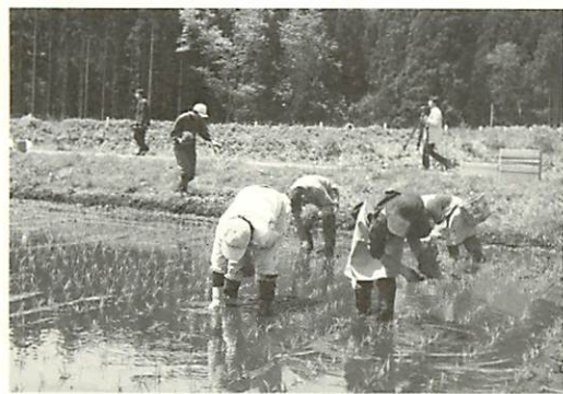
田植えの手つきも慣れたものです

恒例の田植えも無事終了 ワークステーションの恒例行事となっている田植え。今年も五月二十六日に行われました。今年もあきたこまち四〇㍓、ひめのもち(餅米) 四〇㍓を無事植え終えました。 当施設での水稲栽培は今年で六年目。「あそこ植え直しだね」「泥を平らにしておきます」と利用者も慣れた手つきで田植え作業を進めていきます。 この収穫したお米は、利用者の昼食や配食サービスの弁当、お味噌の麴を中心に、使われる予定です。