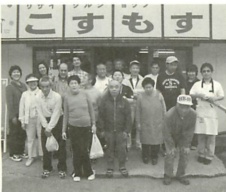
「また元気で会いましょう」と皆で写真をとりました