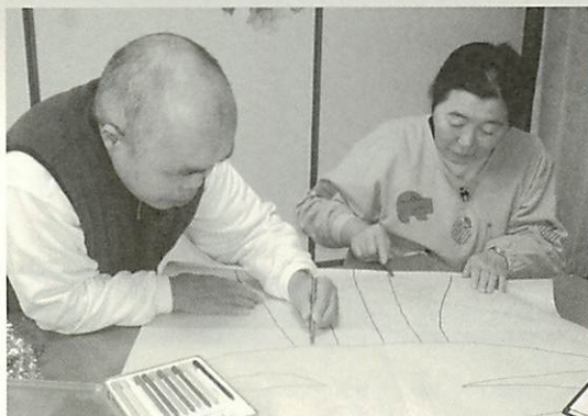
行事に向けて共同制作に取り組む入居者