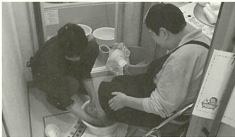
「きもちいい〜」と足浴でリラックス