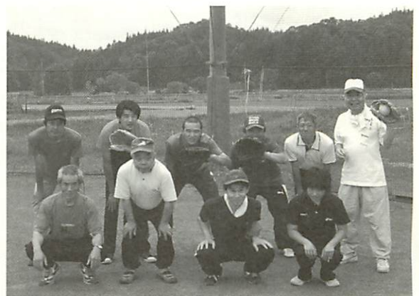
気合い十分のメンバー!もちろん理事長も!

数年前より、ワークステーションでソフトボールチームを結成したいという要望が出ていました。検討を重ね、今年度より利用者の体力づくりを目的として、スポーツクラブを創設しました。卓球、フライングディスクなど様々な活動が予定されていますが、今年度はソフトボールに絞り活動を開始しました。参加メンバーも現在では九人。職員と一緒に活動で汗を流しています。 打って走って守る、最初の頃はなかなかできませんでしたが、今では目を見張る上達が!七月上旬には試合も決定。現在それに向け猛特訓中です。今後のワークステーションソフトボールチームの活躍に乞うご期待!